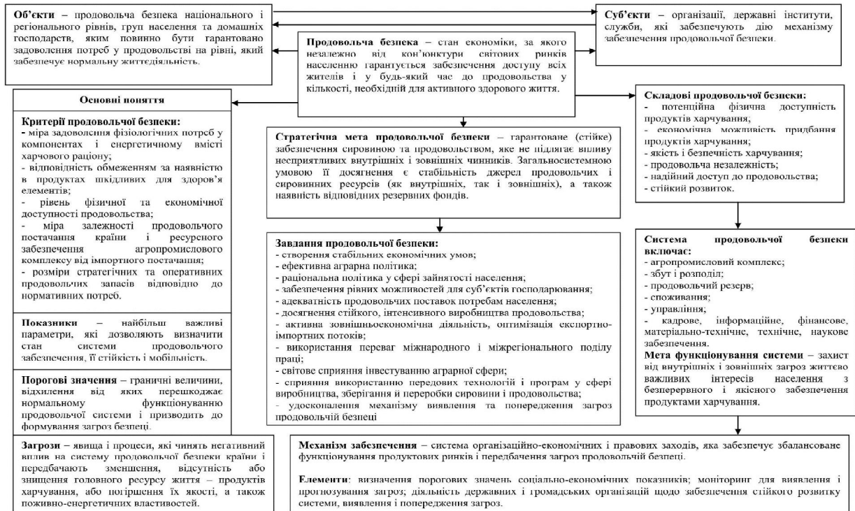
Рис. 2. Основні поняття та складові системи продовольчої безпеки (розроблено автором)

Висновки. У загальних рисах продовольча безпека являє собою гарантоване забезпечення сировиною та продовольством, не схильне до впливу несприятливих внутрішніх і зовнішніх факторів. Умовами такого забезпечення є стабільність джерел продовольчих та сировинних ресурсів як внутрішніх, так і зовнішніх, а також наявність відповідних резервних фондів. Вихідним принципом продовольчого забезпечення має бути відповідність його завданням відтворення народонаселення, збереження активної життєдіяльності людини та вдосконалення її природи.