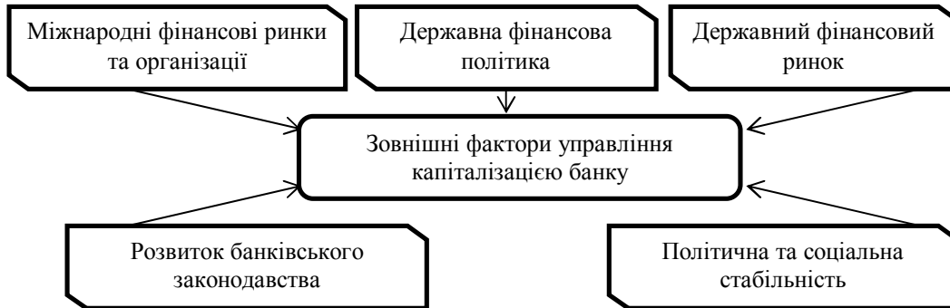
Рис. 1. Внутрішні фактори управління капіталізацією банківської установи

Зовнішні фактори, що мають суттєвий вплив на процес управління капіталізацією банку, наведено на рисунку 1.