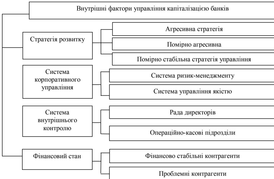
Рис. 2. Класифікація внутрішніх факторів управління капіталізацією банку

Що стосується внутрішніх факторів, то, як наведено на рис. 2, до внутрішніх факторів управління капіталізацією банків відносять: стратегію розвитку банку, систему корпоративного управління, систему внутрішнього контролю, фінансовий стан банку [10].