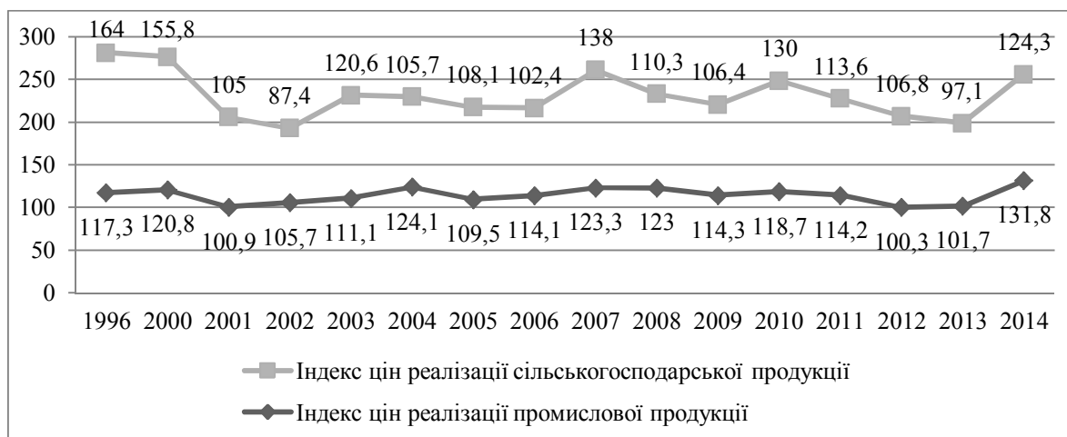
Рис. 2. Індеси цін реалізації промислової та сільськогосподарської продукції в Україні у 1996 – 2014 рр.

Відтворення основних засобів аграрних підприємств потребує значних капіталовкладень і зазвичай власних фінансових ресурсів: чистого прибутку й амортизаційних відрахувань. Зменшення обсягу прибутку і рентабельності аграрних підприємств обумовлено: диспаритетом цін на промислову продукцію, яку використовують у господарствах, та вироблену ними сільськогосподарську продукцію; зростанням витрат на поточні ремонти зношеної техніки.