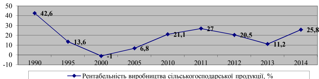
Рис. 3. Рентабельність виробництва сільськогосподарської продукції сільськогосподарськими підприємствами в Україні в 1990–2014 рр., % [9, с. 51]

Рентабельність усієї й операційної діяльності сільськогосподарських підприємств України відповідно знизилася із 17,5 і 24,5% у 2010 р. до 8,8 та 21,1% у 2014 р. (табл. 3). А рентабельність виробництва сільськогосподарської продукції з 1990 р. до 2013 р. знизилася вчетверо. Але вдвічі збільшилась у 2014 р. порівняно з 2013 р. (рис. 3).