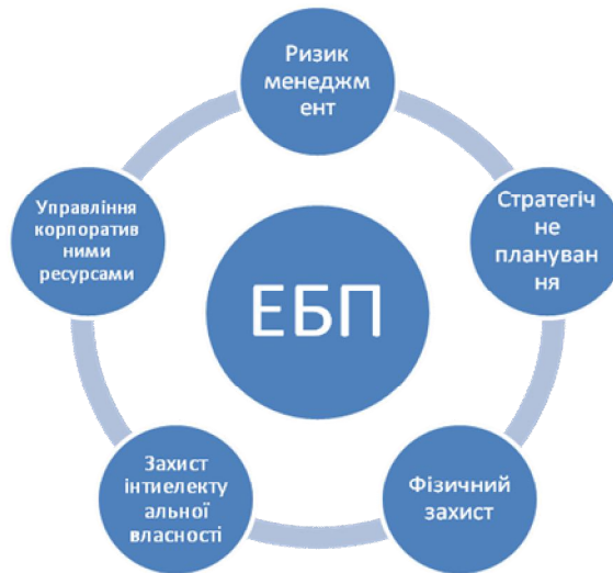
Рис. 2. Визначені елементи системи управління економічною безпекою підприємства

На рисунку 3 запропоновано модель адаптивної системи управління економічною безпекою підприємства. На суб'єкт управління АСУ ЕБП в запропонованій моделі покладено завдання здійснення систематичного пошуку існуючих негативних тенденцій на підприємстві, прогнозування їх виникнення на довго-, середньо- та короткострокову перспективу й генерування управлінських рішень щодо мінімізації їх впливів. Об'єктом управління є всі без винятку елементи внутрішнього середовища підприємства, які несуть у собі потенційну загрозу існуванню підприємства.