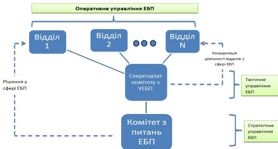
Рис 3. Структура адаптивної системи управління економічною безпекою