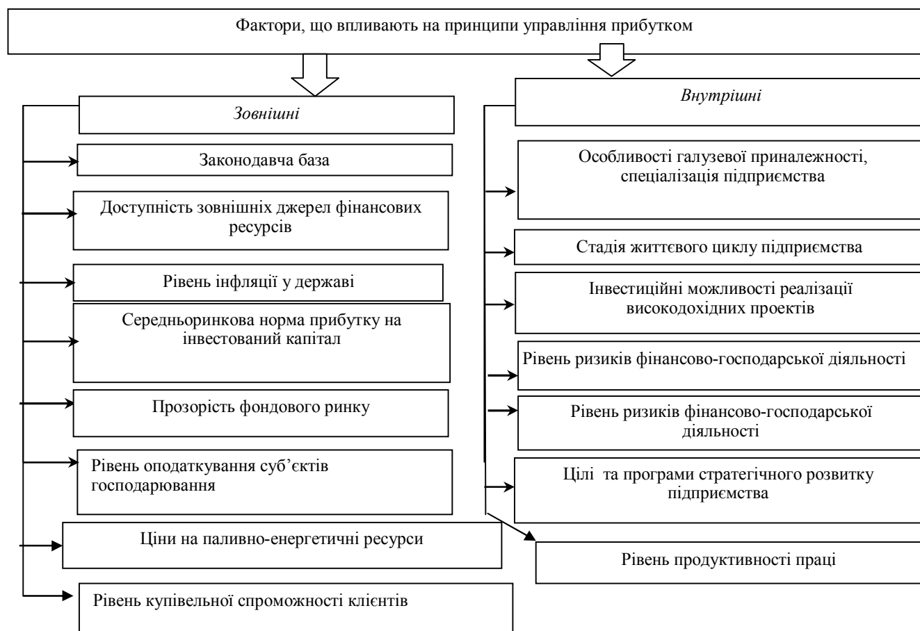
Рис. 2. Фактори, які впливають на принципи управління прибутком [6]