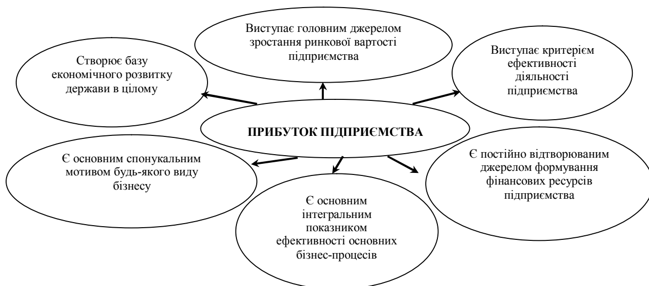
Рис. 1. Роль і значення прибутку підприємства [узагальнено на основі роботи [5]]

У свою чергу прибуток звичайної діяльності поділяється на прибуток від операційної, інвестиційної й фінансової діяльності. Визначення фінансових результатів полягає в знаходженні чистого прибутку (збитку) звітного періоду. Так, згідно з П(С)БО 3 «Звіт про фінансові результати»: прибуток – сума, на яку доходи перевищують пов'язані з ними витрати; збитки – перевищення суми витрат над сумою доходів, для отримання яких здійснені ці витрати [2]. Для визначення фінансових результатів у бухгалтерському обліку передбачається послідовне зіставлення доходів і витрат, здійснених для отримання цих доходів від усіх видів діяльності.