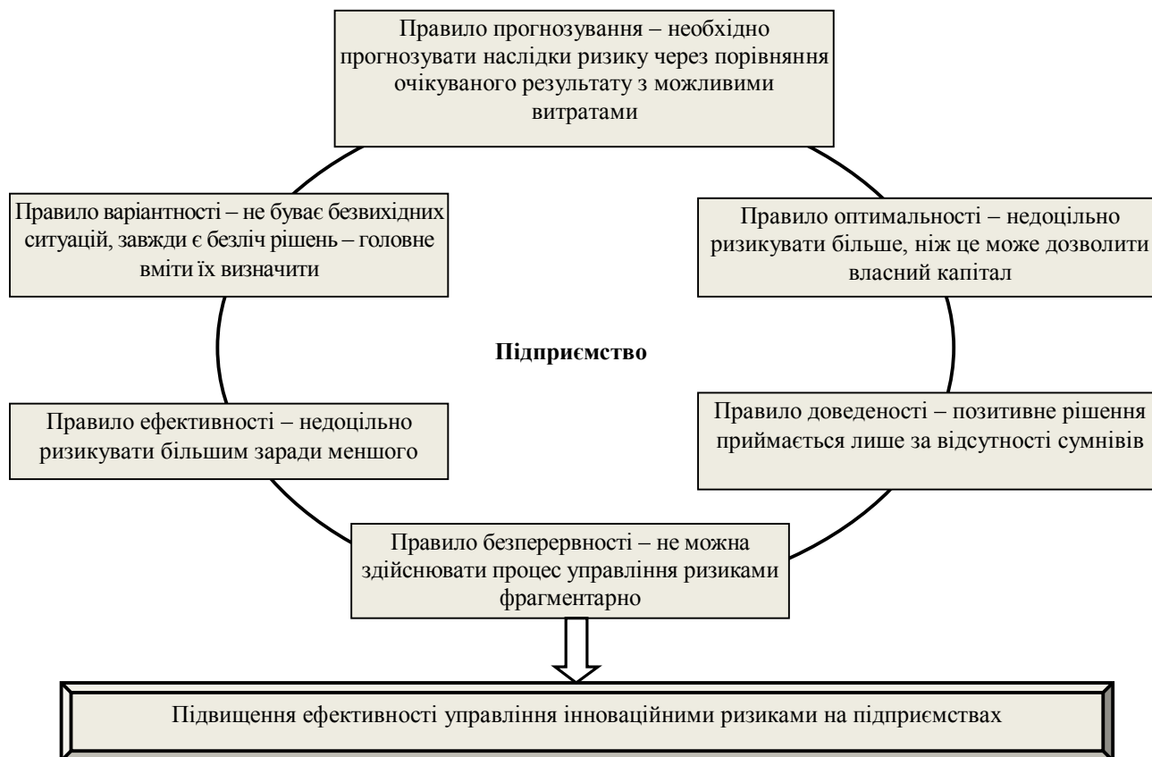
Рис. 2. Правила, яким необхідно слідувати з метою підвищення ефективності управління інноваційними ризиками на вітчизняних підприємствах

Виділимо основні шість правил, яким необхідно слідувати з метою підвищення ефективності управління інноваційними ризиками (рис. 2).