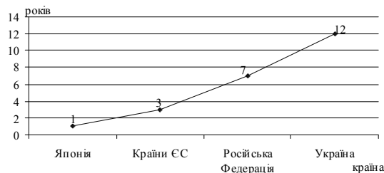
Рис. 2. Періодичність підвищення кваліфікації у різних країнах

Економіка знань потребує не лише зростання серед працівників частки осіб з вищою освітою, але і постійного підвищення рівня кваліфікації. Однак в Україні цій проблемі надається ще недостатня увага (рис. 2).