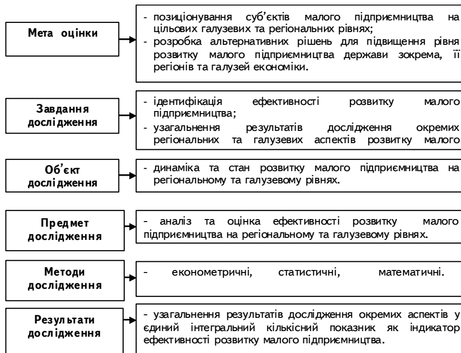
Рис. 2. Функціонально-організаційна структура рейтингової оцінки регіонального та галузевого розвитку малого підприємництва (розробка автора на основі джерел [6–9])

Для ґрунтовної та порівняльної оцінки доречним є формування еталону з середніх значень показників розвитку малого підприємництва по Україні, що дозволяє не лише скласти рейтинг, але й визначити ті регіони і галузі економіки, які функціонують на вищому чи нижчому рівнях від середньостатистичного значення суб'єктів малого підприємництва в Україні.