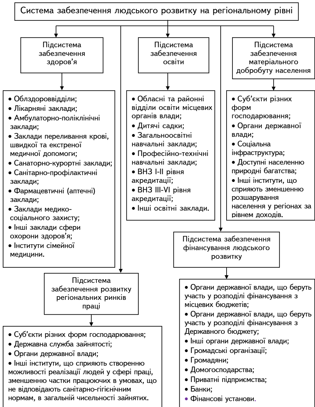
Рис. 2. Архітектура системи забезпечення людського розвитку на регіональному рівні (авторська розробка)