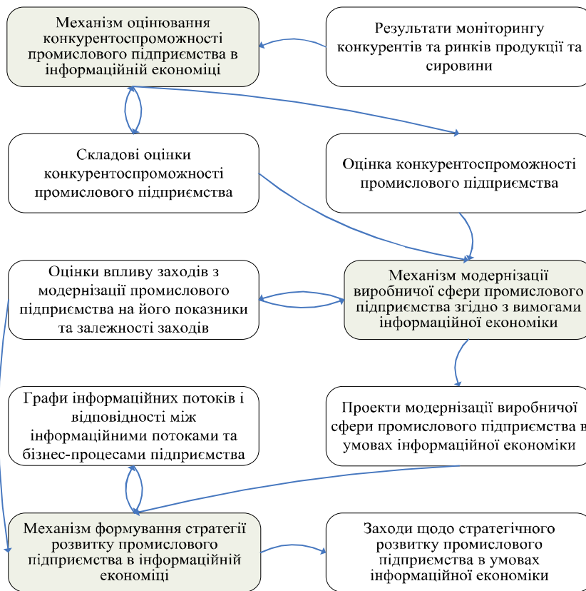
Рис. 2. Послідовність функціонування механізмів управління розвитком

Висновки. Таким чином, встановлено, що управління розвитком промислового підприємства в умовах інформаційної економіки потребує від керівників врахування комплексу проблем, що постають перед підприємством внаслідок стрімких змін у зовнішньому середовищі, передусім в аспекті виникнення нових технологій інформатизації та автоматизації виробничої та торговельної діяльності. Тому для управління розвитком необхідна наявність цілісної концепції, що являє собою обґрунтування системи теорій, механізмів, засобів, моделей, методів та інших інструментів для розробки управлінських рішень на промисловому підприємстві при встановленій цілі розвитку підприємства та в умовах зовнішнього середовища, що має риси інформаційної економіки.