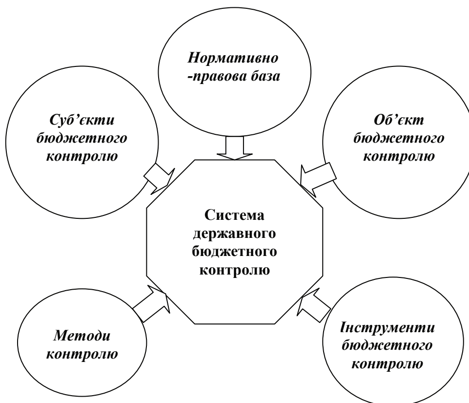
Рис.2. Організація системи державного бюджетного контролю

На нашу думку, обов'язковою умовою створення справедливої системи контролю за дотриманням законодавства повинні бути норми, які визначають засади процесів попередження бюджетного правопорушення, виявлення його на початкових стадіях із нанесенням мінімальної шкоди для фінансової стійкості бюджетів, встановлення відповідальності за вчинення порушення, а також в особливих випадках оскарження рішень про накладання стягнень за бюджетне правопорушення. Згідно з положеннями БКУ, відповідне рішення може бути оскаржено в органі, який його виніс, або в суді впродовж 10 днів з дня його винесення, якщо інше не передбачено законом. Оскарження рішення про накладання стягнень за бюджетне правопорушення не зупиняє виконання зазначеного рішення. У разі визнання судом рішення незаконним особою, щодо якої воно було винесено, перераховуються недоотримані бюджетні кошти, поновлюються інші обмежені таким рішенням права (стаття 124 БКУ) [2].