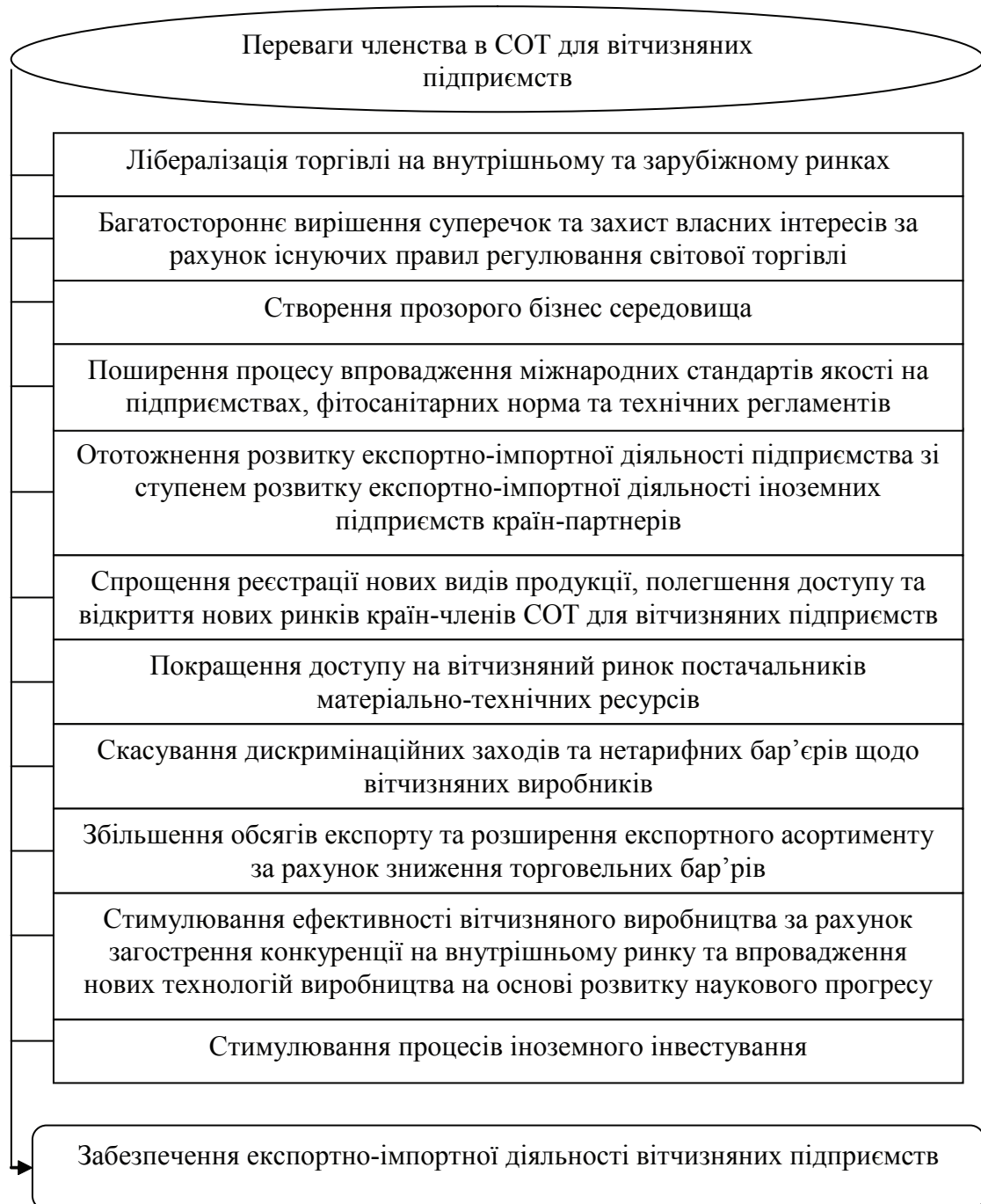
Рис.1. Переваги членства України в СОТ у розвитку експортно-імпоротної діяльності вітчизняних підприємств*

який пов'язаний з удосконаленням систем стандартизації і сертифікації, технічних регламентів та фітосанітарних норм щодо експортованої продукції. Як результат, для такого регулювання вдосконалюватиметься законодавча база та змінюватиметься підхід в рамках кардинальних реформ у сфері технічного регулювання [5, с. 148].