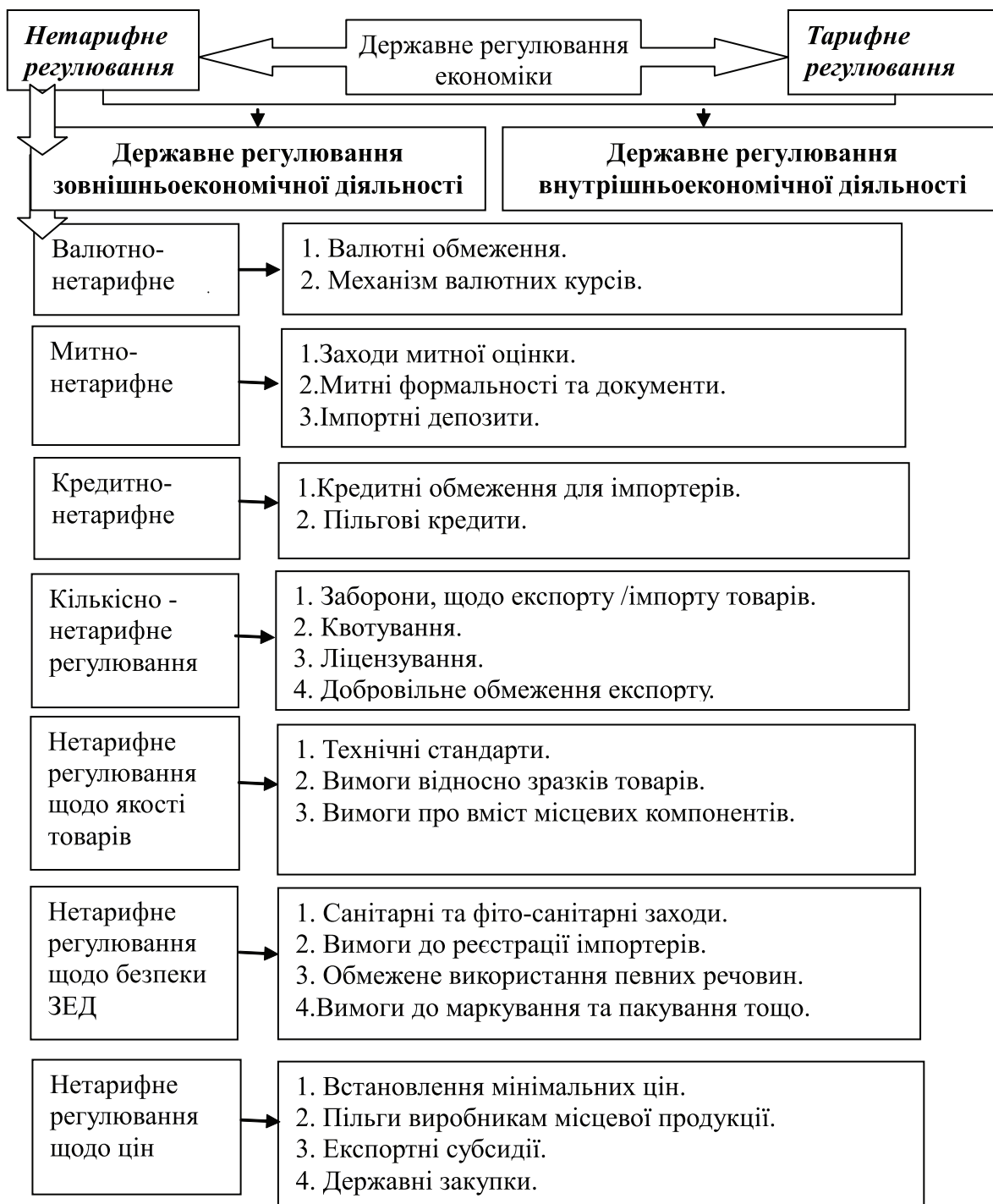
Рис. 1. Місце нетарифного регулювання зовнішньоекономічної діяльності в державному регулюванні економіки

К. Гапотченко [6, С.37] називає нетарифні заходи адміністративним засобом, що носить характер прямих обмежень, які не можна подолати на основі конкуренції та відносить їх разом з тарифними та паратарифними інструментами до інструментів протекціонізму.