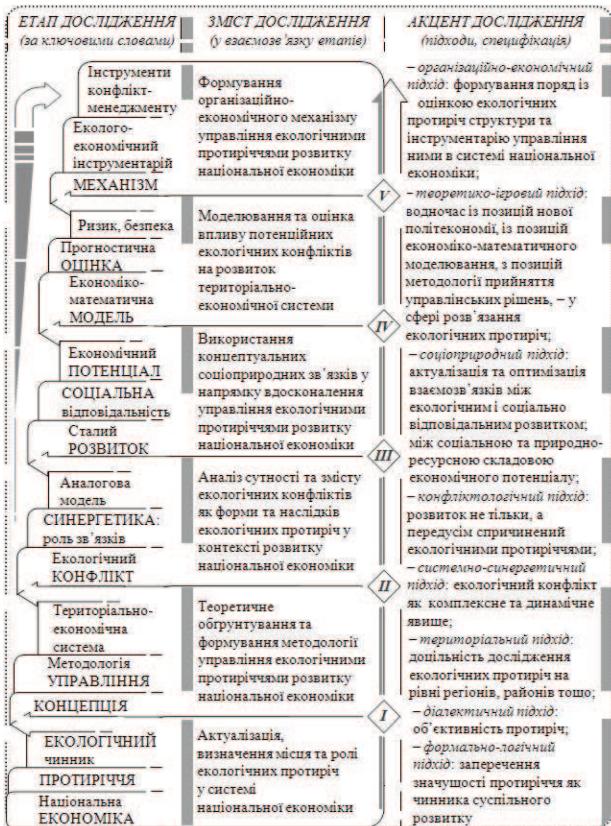
Рис. 2. Концепція дослідження проблеми управління екологічними протиріччями розвитку національної економіки: від актуалізації – до формування організаційно-економічного механізму