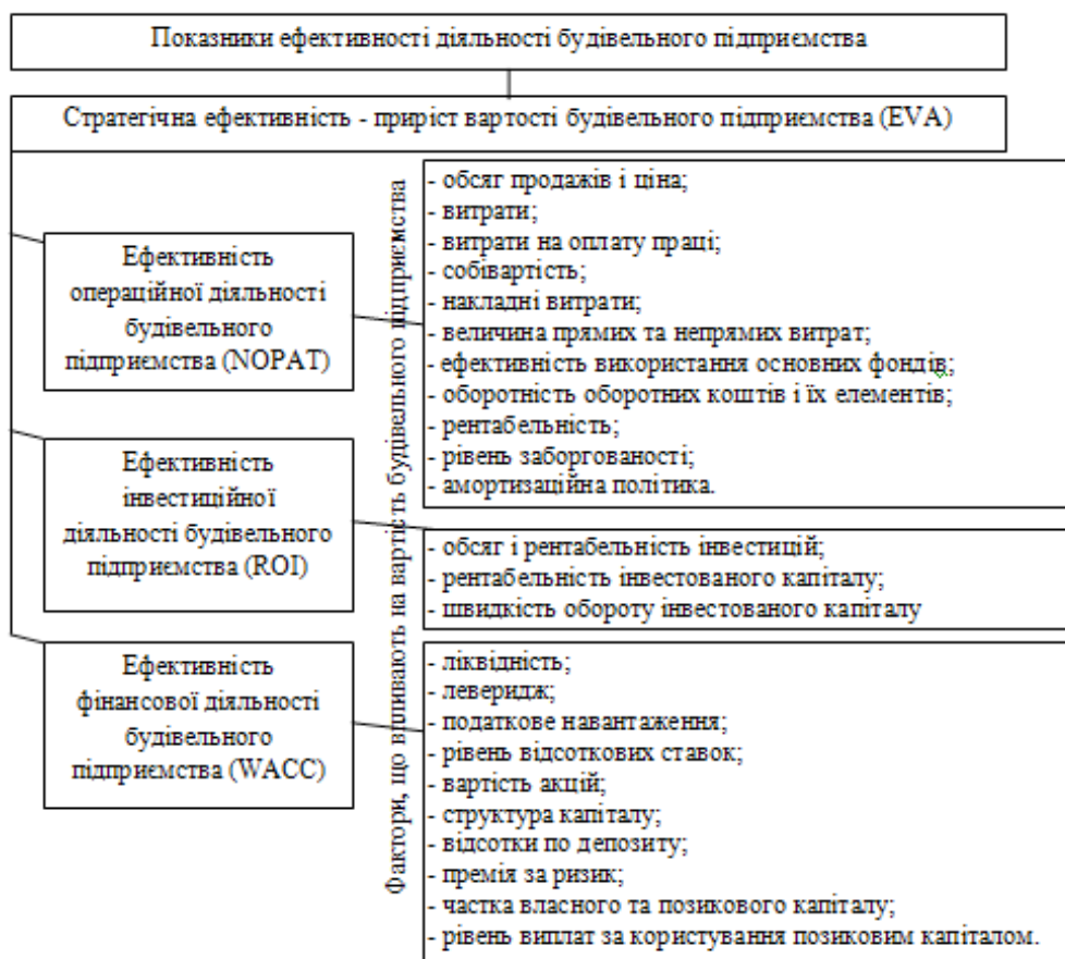
Рис. 1. Фінансові показники вартості будівельних підприємств та фактори, що впливають на них

інвестиційних проектів підприємства. Тривалість виробничого циклу обумовлює великі терміни окупності проектів, що призводить до істотного відволікання фінансових ресурсів з обороту і збільшення проектних ризиків. Ефективність фінансової діяльності відображає ефективність залучення фінансових ресурсів, розміщення вільних грошових коштів, управління оборотним капіталом. Висока капіталомісткість процесу будівельного виробництва обумовлює потребу в тривалому позиковому фінансуванні. Цілеспрямоване управління факторами (наприклад, собівартістю продукції, станом матеріально-технічної бази, капітальними вкладеннями, вкладеннями в нематеріальні активи), дозволяє оптимізувати управління фінансовими потоками з метою створення і збільшення вартості будівельних підприємств.