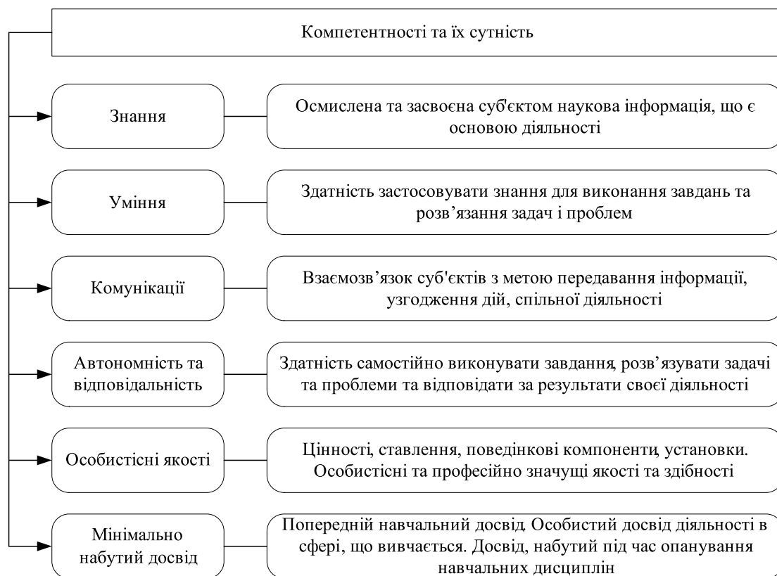
Рис. 2. Сутність компетентностей, що формуються у студента

Кожен фахівець залежно від своїх здібностей, психологічних характеристик, якості отриманих знань та практичної діяльності опановує ту чи іншу компетентність більш чи менш ефективно. Компетентність як категорія відтворюється у кожної особистості у вигляді здатності її реалізувати. Конкретизація сутності компетентностей подана на рис. 2 [16; 19; 20].