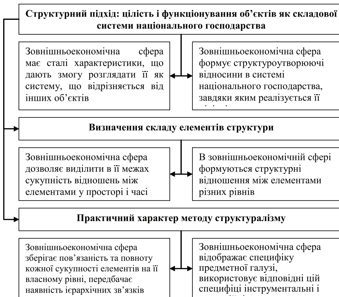
Рис. 2. Узагальненні підходи теорії структуралізму які доцільно використовувати для формування методологічних основ системно-структурного розвитку зовнішньоекономічної сфери національного господарства.

Узагальнення підходів теорії структуралізму дозволяють сформулювати основні положення, які мають використовуватися відносно зовнішньоекономічної сфери національного господарства (рис. 2).