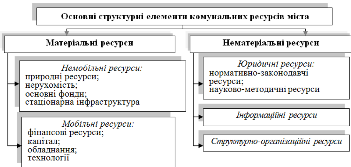
Рис. 1. Основні структурні елементи ресурсів територіальної громади міста

територіальної громади міста зображено на рис. 1.