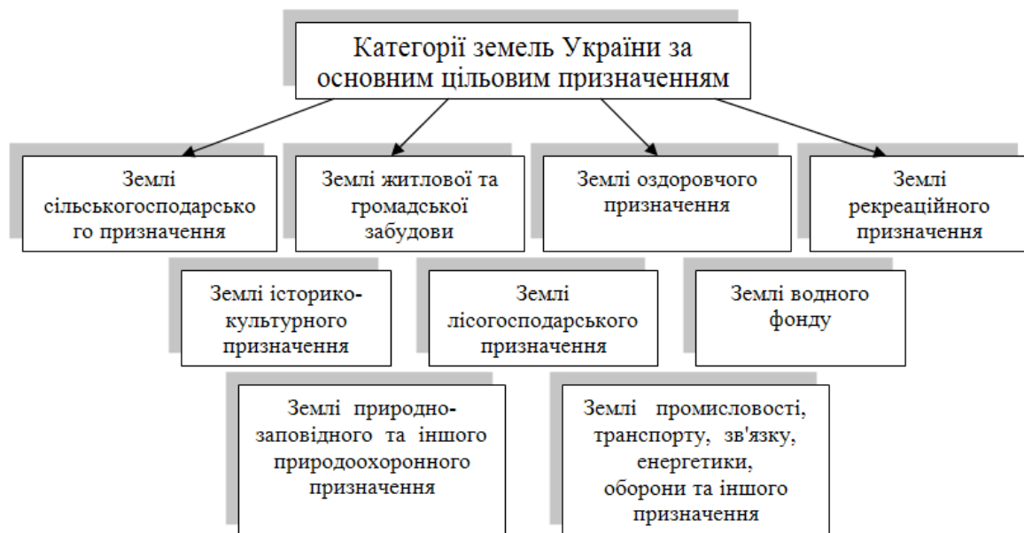
Рис. 2. Категорії земель України за основним цільовим призначенням

Згідно із Земельним кодексом України до земель України належать усі землі в межах її території, в тому числі острови та землі, зайняті водними об'єктами, які за основним цільовим призначенням поділяються на категорії (рис. 2) [7]. У комунальній власності перебувають усі землі в межах населених пунктів, крім земель приватної та державної власності, а також земельні ділянки за їх межами, на яких розташовані об'єкти комунальної власності.