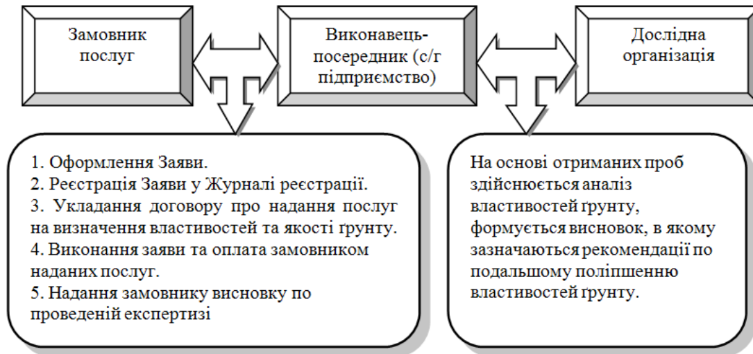
Рис. 2. Схема здійснення операцій по виконанню Заяви на визначення властивостей та якісних характеристик ґрунту

господарств, оскільки результати аналізу свідчать про якість ґрунтів та дають рекомендації щодо внесення органічних та/або мінеральних добрив, вказуючи при цьому їх норму.