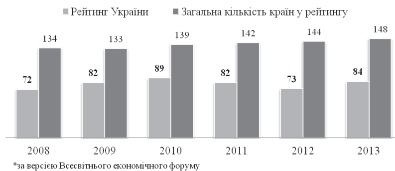
Рис. 1. Динаміка зміни індексу глобальної конкурентоспроможності України у 2008-2013 рр. (складено за даними [6])