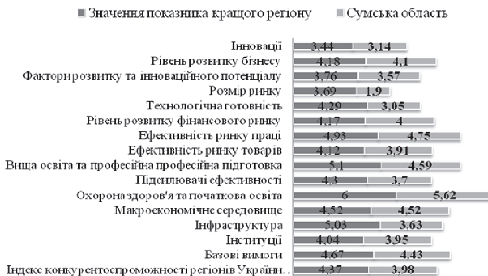
Рис. 3. Результати оцінки Сумської області за 12 складовими конкурентоспроможності (складено за даними [5])

З метою пошуку резервів зростання конкурентоспроможності області нами було здійснено оцінку ефективності ресурсокористування у регіонах України. Зважаючи на наявну статистичну інформацію та цілі нашого дослідження, для оцінки резервів й аналізу напрямів раціоналізації ресурсокористування використовувалися такі часткові показники ресурсовитрат: водо-, відходо-, повітро-, паливо- та капіталоємність валового регіонального продукту (ВРП), що характеризують матеріальну складову ресурсокористування.