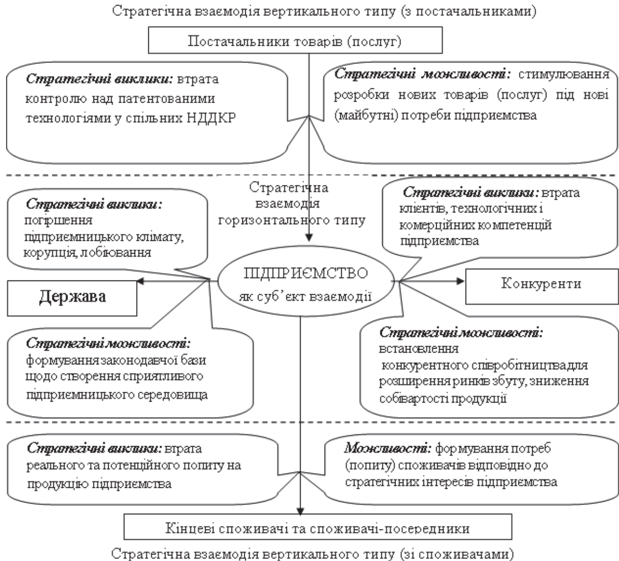
Рис. 1. Фрагмент основних стратегічних можливостей і викликів для підприємства при взаємодії із суб'єктами зовнішнього середовища

впливу суб'єкта на об'єкт управління. Водночас, відповідно запропонованого трактування економічної безпеки, в основу управління має покладатися відтворювальний підхід і об'єктом управління економічною безпекою підприємства повинен бути процес відтворення на підприємстві.