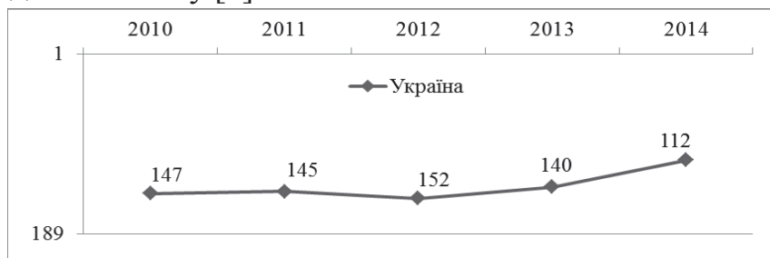
Рис. 1. Динаміка змін позиції України у Рейтингу умов ведення бізнесу за 2010–2014 роки [1]

Результати рейтингу Світового банку «Doing Business–2014» показують, що за останні декілька років Україна значно підвищила свої позиції щодо поліпшення регуляторного середовища (рис.1) та очолила список з десяти держав, які досягли найбільшого прогресу у покращенні умов для ведення бізнесу [1].