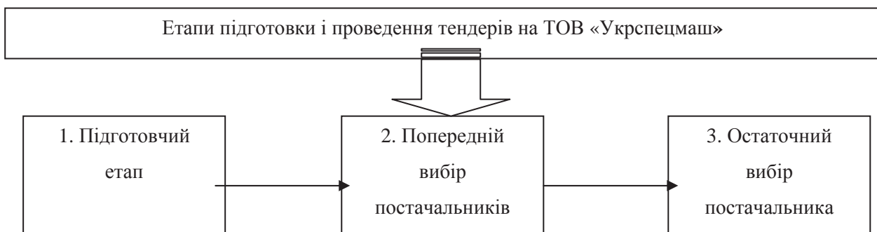
Рис.3. Порядок проведення тендерів на ТОВ «Укрспецмаш»

Підготовку і проведення тендерів на заводі проводять у три етапи (рис. 3.):