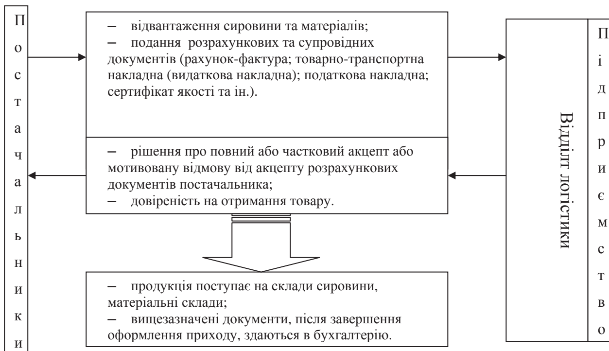
Рис. 1. Порядок оформлення постачань сировини та матеріалів на ТОВ «Укрспецмаш»

Якість продукції, яку виробляють на ТОВ «Укрспецмаш», безпосередньо, залежить від якості сировини, матеріалів, комплектуючих виробів тощо. Саме тому, керівництву заводу слід приділяти посилену увагу оптимізації витрат заводу на виробництво продукції та будувати свої стосунки з постачальниками на взаємовигідних умовах. За результатами аналізу порядку оформлення основної сировини та матеріалів, які поступають від постачальників на ТОВ «Укрспецмаш» (рис.1).