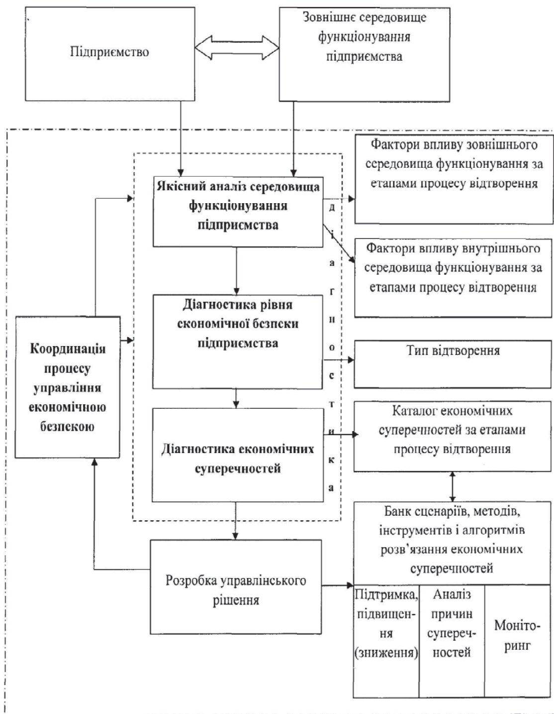
Рис. 3. - Структура системи управління економічною безпекою підприємства

Висновки. Для підвищення ефективності управління і забезпечення необхідного рівня економічної безпеки для підтримки життєво важливих функцій підприємства і реалізації його потенціалу було розроблено теоретичні положення щодо діагностики економічної безпеки підприємства в умовах нестабільного економічного середовища, які передбачають структурування та класифікацію процесів щодо