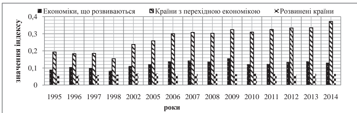
Рис. 3. Динаміка індексу концентрації товарного експорту по макрорегіонах за методологією ЮНКТАД за 1995-2014рр.