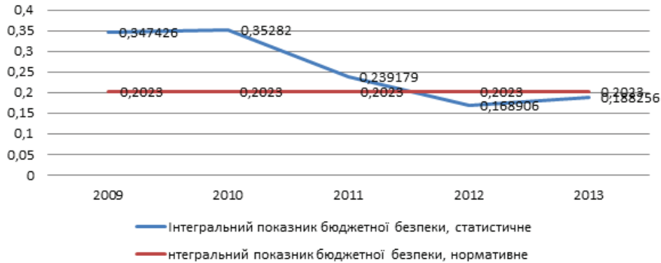
Рис. 2. Динаміка інтегрального показника бюджетної безпеки

Як видно з таблиці 2 нормовані значення індикаторів бюджетної безпеки мають тенденцію до зниження, які в свою чергу впливають на зниження інтегрованого показника по відношенню до нормативного значення, яке знаходиться в межах 0,20203 (рис.2).