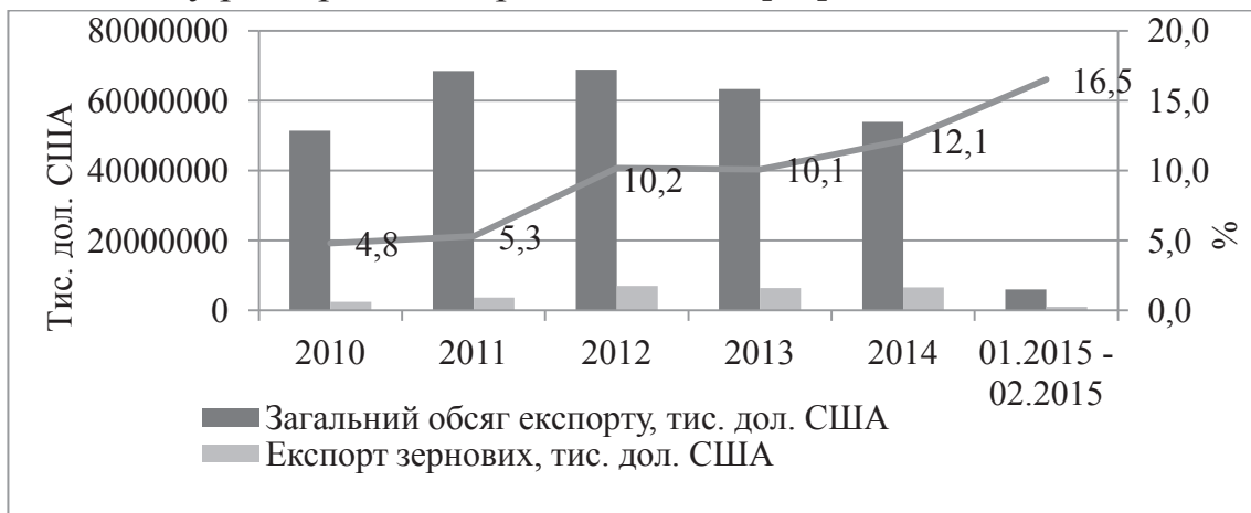
Рис. 2. Динаміка частки зернових в загальному обсязі експорту з України протягом 2010 – 2015 років *

Така тенденція сприятливо позначилась на позитивному значенню сальдо зовнішньоторговельного балансу України, яке в 2014 році становило 3,88 млрд. дол. США скоротившись у четвертому кварталі на 0,37 млрд. дол. США, тоді як за підсумками 2013 року сальдо було негативним у розмірі 8,51 млрд. дол. США [10].