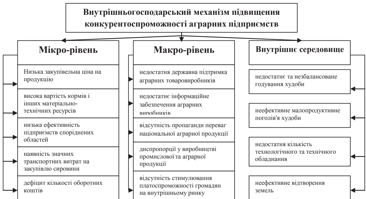
Рис. 2 Класифікація факторів, що впливають на підвищення конкурентоспроможності аграрних підприємств

Вчені вважають, що залежно від того, на скільки підприємства впливають на фактори виробництва, їх можна розділити на три групи: внутрішні чинники підприємства; мікро-середовище і макро-середовище (рис.2).