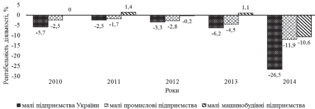
Рис. 3. Динаміка рентабельності (збитковості) діяльності малих підприємств України за 2010-2014 рр.

Джерело: складено автором на основі [11]