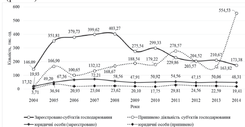
Рис. 2. Динаміка суб'єктів господарської діяльності в Україні за 2004-2014 рр.

Відзначаючи позитивні реформи в Україні щодо розвитку підприємництва та враховуючи зростання України в рейтингу легкості ведення бізнесу проведемо аналіз кількості суб'єктів господарювання, що розпочали чи припинили господарську діяльність в Україні за 2004-2014 рр. (рис. 2).