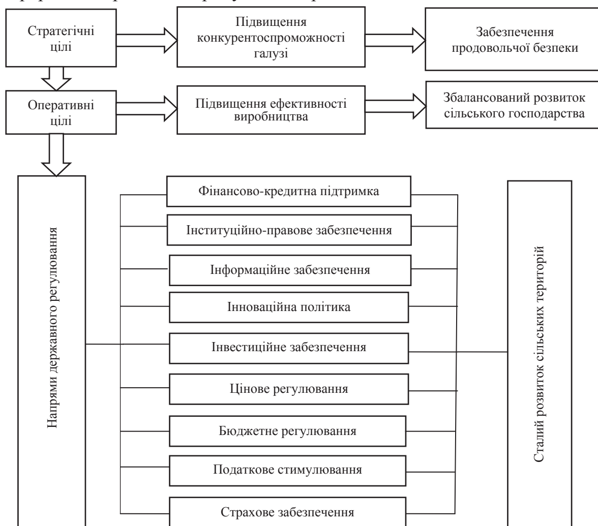
Рис. 2. Цілі та напрями державного регулювання галузі тваринництва

Перспективним напрямом розвитку тваринництва в сільськогосподарських господарствах Тернопільської області є структурна перебудова у тваринництві, яка реалізується через механізм державної підтримки галузі, який включає: удосконалення фінансово-кредитної та інвестиційної політики держави в питаннях прискореного нарощування поголів'я тварин; реструктуризація кормової бази для забезпечення поголів'я повноцінними високоякісними кормами; впровадження інноваційних технологій утримання худоби та птиці; видача державних траншів найбільшим виробникам м'яса; часткове відшкодування державою основних витрат на будівництво та реконструкцію тваринницьких комплексів після їх введення в експлуатацію, насамперед на умовах фінансового лізингу; переведення галузі тваринництва на промислову основу з організацією самостійної переробки виробленої продукції для реалізації.