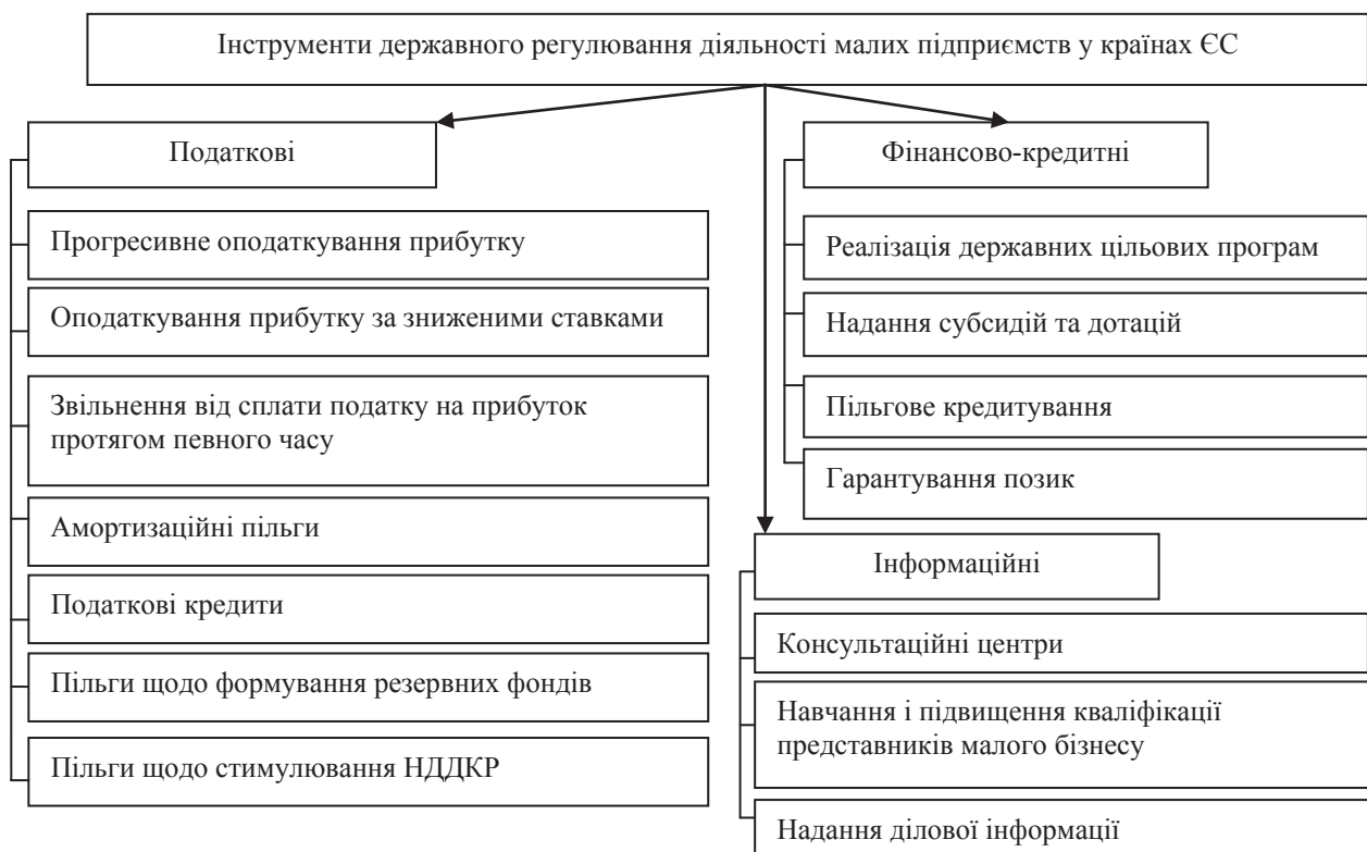
Рис. 3 Інструменти регулювання діяльності малих підприємств у країнах ЄС

Аналіз регулювання діяльності малих підприємств у розвинених країнах дає підстави стверджувати, що його основними інструментами є податкові, фінансово-кредитні та інформаційні (рис. 3).