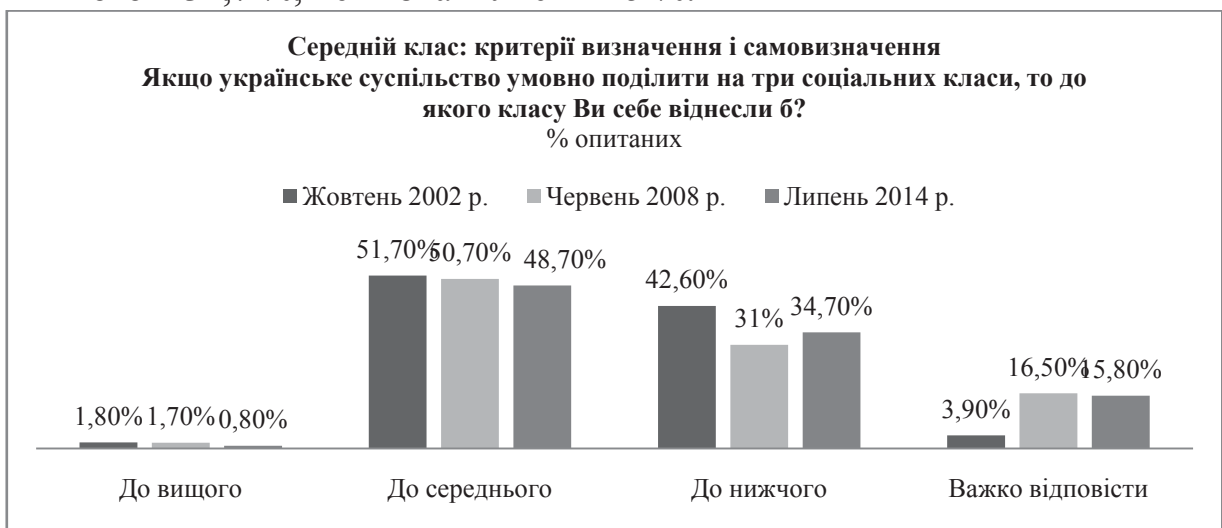
Рис.3. Середній клас: критерії визначення та самовизначення. Відношення до відповідного класу людей за самовизначенням

У 2015 році Центром Разумкова було проведено опитування населення України щодо віднесення себе до середнього класу за критеріями визначення та самовизначення (рис. 3). Так, у 2014 році до вищого класу себе віднесло 0,8% населення, до середнього класу – 48,7%, до нижчого – 34,7%, не визначились – 15%.