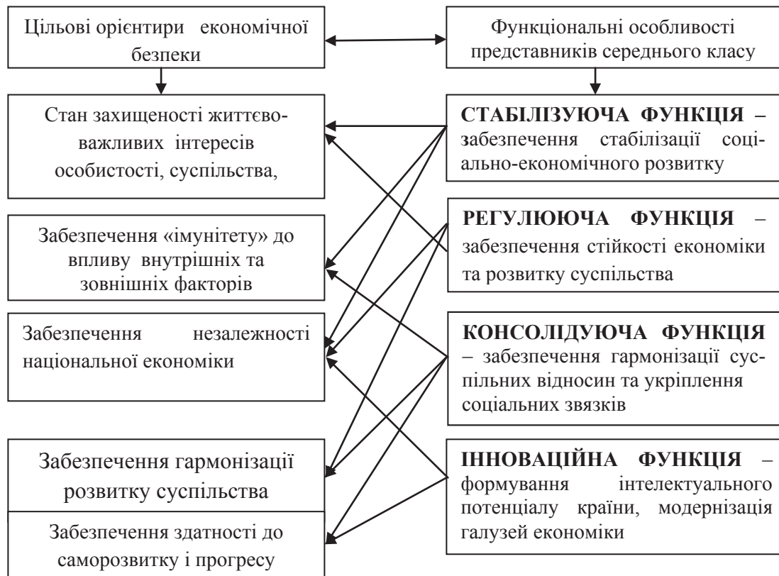
Рис. 1. Роль середнього класу в системі економічної безпеки