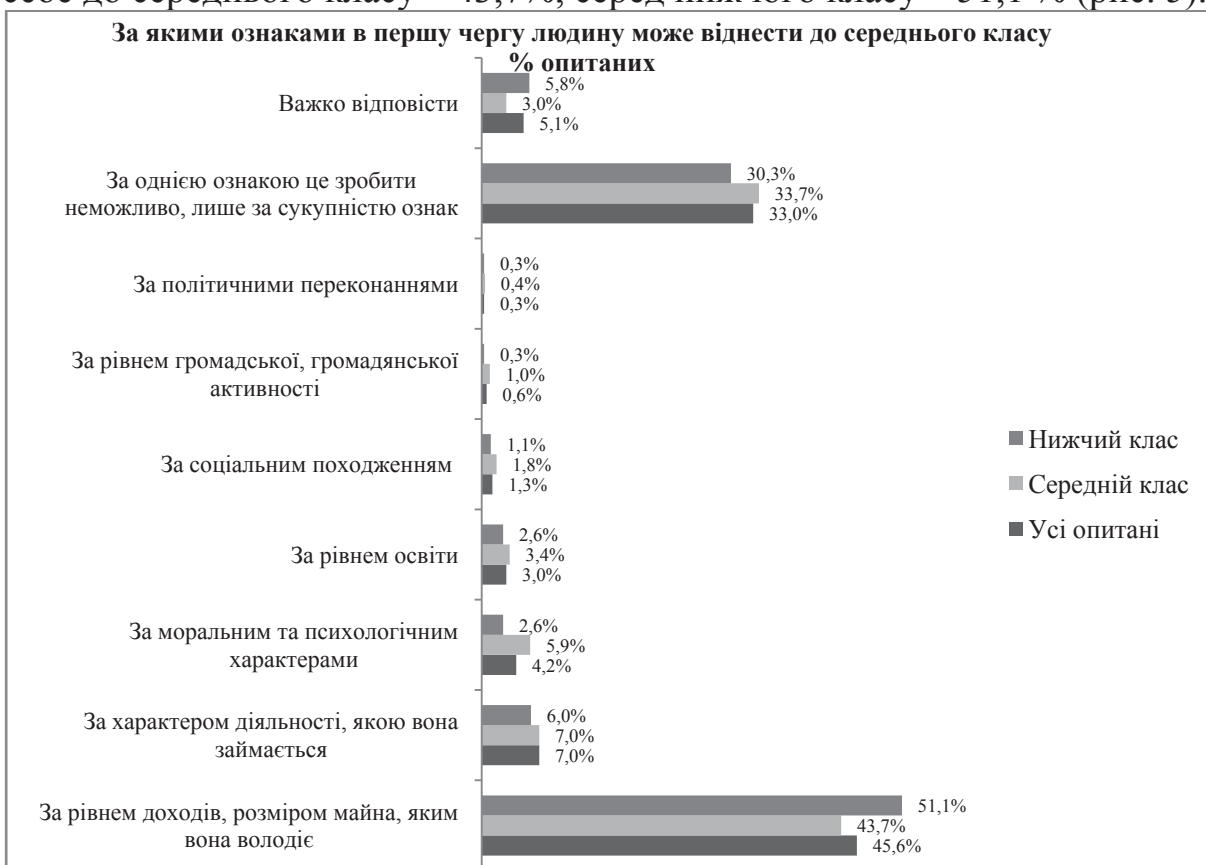
Рис. 5. Результати опитування за ознаками, за якими людину можна віднести до середнього класу Джерело: [7]

На питання: за якими ознаками в першу чергу людину можна віднести до середнього класу? - найбільша частка опитаних вважає, що такою ознакою є рівень доходів та розмір майна, яким вона володіє. Серед усіх опитаних ця частка складає 45,6 %, серед тих, хто відносить себе до середнього класу – 43,7%, серед нижчого класу – 51,1 % (рис. 5).