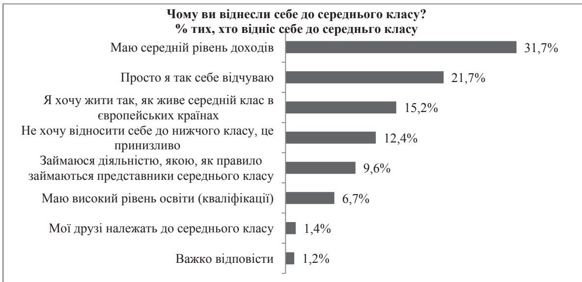
Рис.4. Відсоток тих, хто відніс себе до середнього класу Джерело: [7]

На питання: за якими ознаками в першу чергу людину можна віднести до середнього класу? - найбільша частка опитаних вважає, що такою ознакою є рівень доходів та розмір майна, яким вона володіє. Серед усіх опитаних ця частка складає 45,6 %, серед тих, хто відносить себе до середнього класу – 43,7%, серед нижчого класу – 51,1 % (рис. 5).