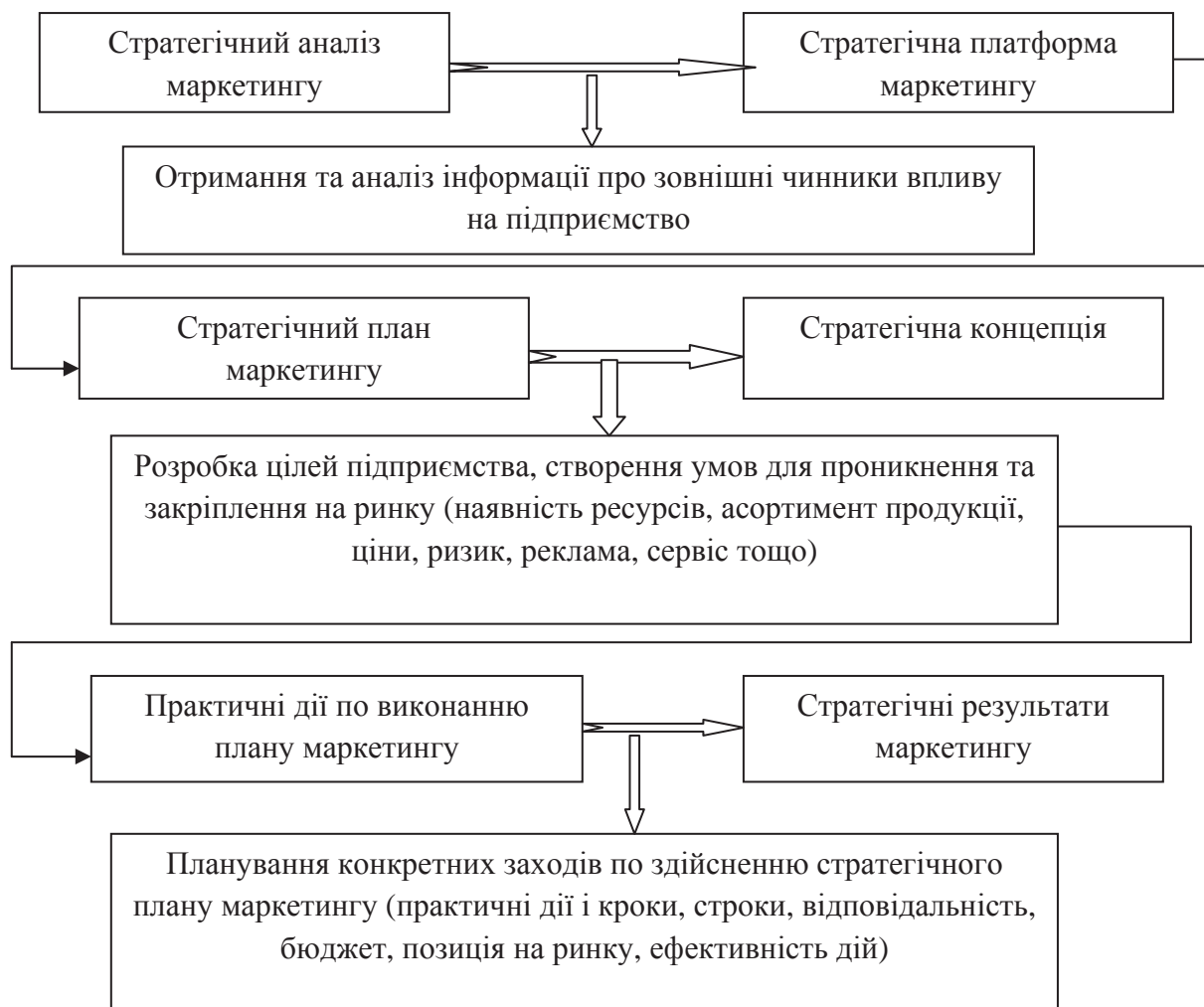
Рис. 2. Послідовність етапів стратегічного планування маркетингу

Деякі підприємства завдяки стратегічному маркетингу мають значну конкурентну перевагу перед суперниками. Їх стратегічний маркетинг включає: справжнє розуміння потреб замовника, забезпечення творчої, професійної презентації продукції. Нижче перераховані деякі з основних маркетингових стратегій, використовуваних провідними підприємствами, щоб переконатися, що вони випереджають конкурентів в області маркетингу, розміщення, бренду і лояльності.