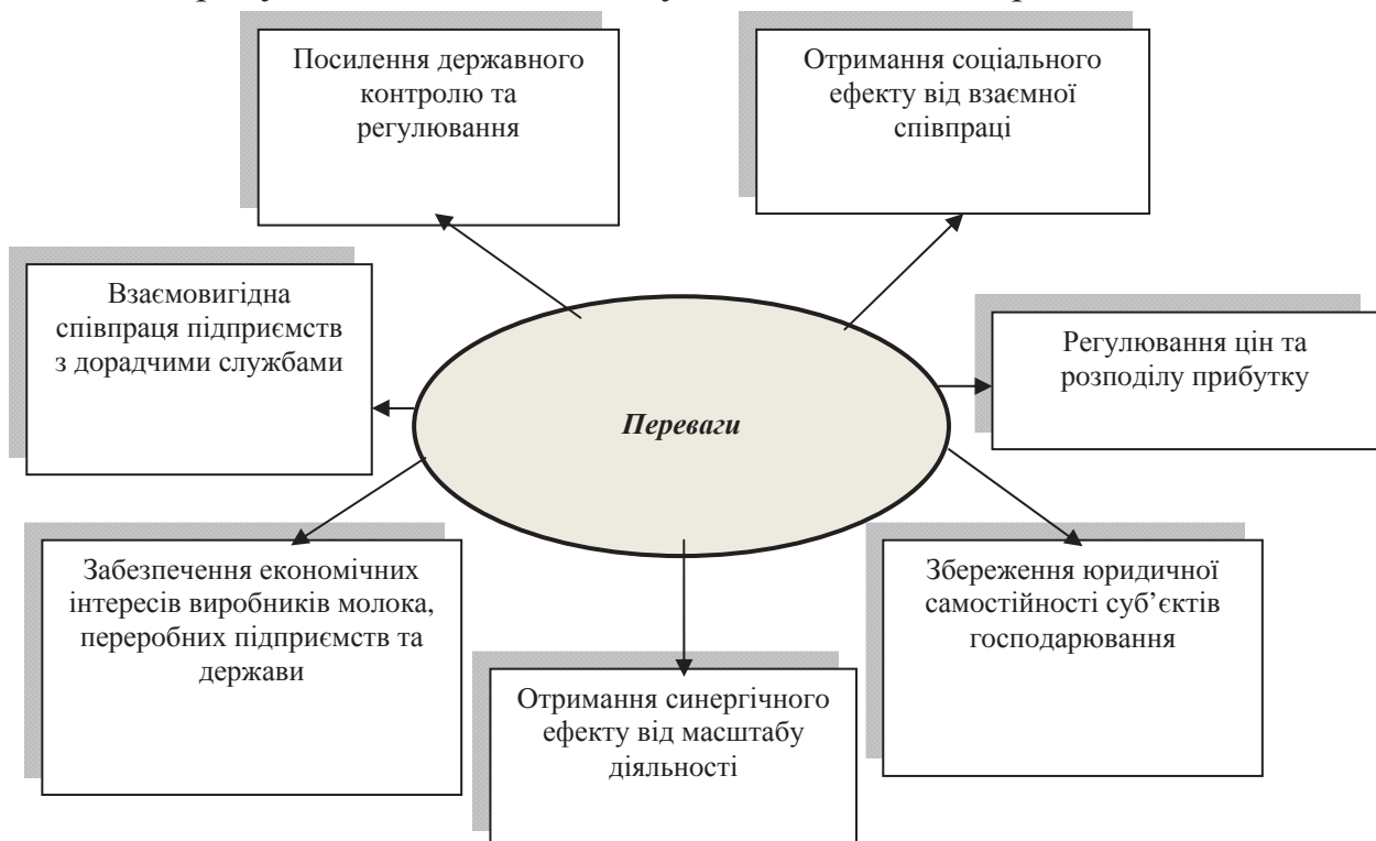
Рис. 3. Переваги створення конвергенційної моделі організації регіонального молокопродуктового підкомплексу АПК

Переваги запропонованої організації регіонального молокопродуктового підкомплексу АПК наведені на рис. 3.