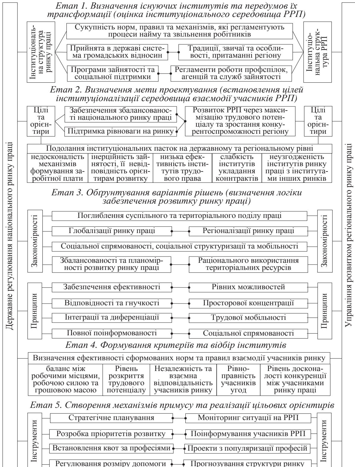
Рис. 1. Співвіднесення етапів організації управління розвитком регіонального ринку праці зі структуризацією предметної області дослідження Розроблено автором

будуть зовсім іншими. При цьому, у будь-якому випадку передбачається наступність означених на рис. 1 елементів в частині додержання ієрархічності будь-якої економічної системи.