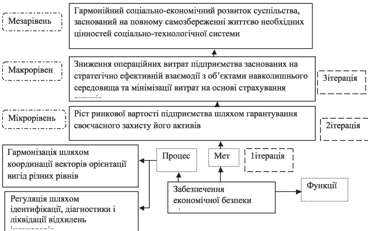
Рис. 2 Система ітераційної діагностики економічної безпеки сільськогосподарського підприємства

Екологічно безпечні системи землекористування в межах сільськогосподарського підприємства також включають в себе найкращу практику управління економічною безпекою сільськогосподарського підприємства. З цією метою необхідна інтеграція інформаційних систем для надання консультацій та офіційних порад керівникам.