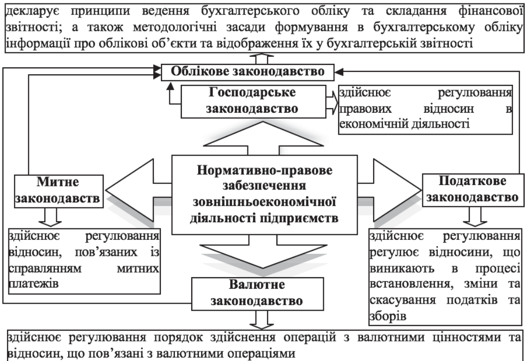
Рис. 1 Система нормативно-правового забезпечення зовнішньоекономічної діяльності підприємств

Основи ведення зовнішньоекономічної діяльності визначено в Законі України «Про зовнішньоекономічну діяльність», який є загальним нормативно-правовим документом, що регулює ряд питань, пов'язаних зі здійсненням господарських операцій підприємствами на закордонних ринках товарів і послуг, капіталу тощо. Положення даного закону окреслюють види та суб'єктів, принципи здійснення та правила регулювання зовнішньоекономічної діяльності, а також особливості укладання зовнішньоекономічних договорів (контрактів) та правила оподаткування і принципи митного регулювання діяльності суб'єктів господарювання. Крім того, розкриваються такі питання, як ведення розрахунків та кредитування суб'єктів зовнішньоекономічної діяльності, страхування і ліцензування, відповідальність та порядок розгляду спорів при здійсненні зовнішньоекономічних операцій.