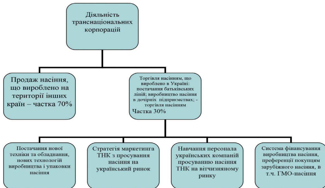
Рис. 1. Збутова діяльність транснаціональних корпорацій на вітчизняному ринку насіння

вітчизняними селекційними установами відбувається за схемою (Рис. 2). В процесі збуту продукції особливе місце відводиться технічній діяльності службі збуту і насінництва. На відміну від стратегії просування продукції в ТНК, вітчизняні селекційні установи не застосовують повною мірою маркетингову складову, технологічний супровід також не включений.