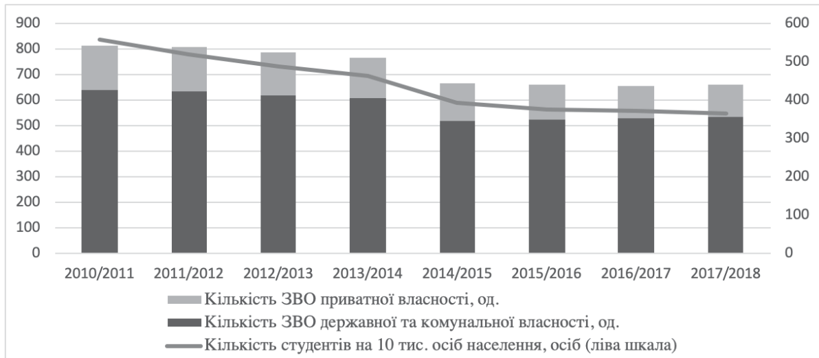
Рис. 1. Показники кількості ЗВО України у 2010-2017 рр. Джерело: побудовано за даними [1]

Виклад основного матеріалу. Як свідчать показники ЗВО України у 2010-2017 рр., їх кількість кожен рік скорочується, проте зменшується також і кількість студентів у існуючому населенні, що може свідчити не тільки про негативні тенденції демографічного скорочення, а й про низьку мотивацію молоді до здобуття вищої освіти (рис. 1).