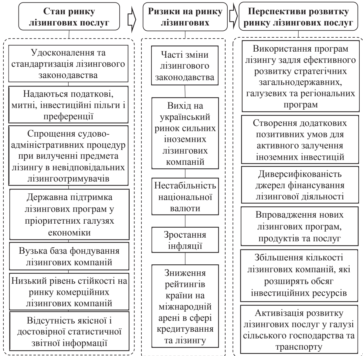
Рис.3. Аналіз напрямів розвитку ринку лізингових послуг в контексті трансформації фінансових відносин в Україні

додаткові позитивні умови для активного залучення іноземних інвестицій. Саме це вирішить питання про нездатність багатьох підприємств України проводити реконструкцію та модернізацію виробництва за допомогою лізингу.