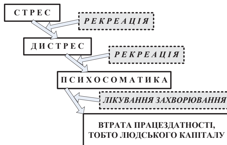
Рис. 2 Місце необхідних процесів рекреації в життєдіяльності людини

Таким чином, здійснені у ХАТМК дослідження кроунограм людей до та після перегляду спектаклів виявили невідоме раніше явище – «здібності» театру «загоювати» енергоінформаційні оболонки («аури») глядачів. Це відкриття підштовхнуло до висновку про ще одну (і може найважливішу) функцію театру – рекреаційну, завдяки чому людина після праці має можливість відпочити і відтворити свій так званий людський капітал [12]. При порушенні цього правила людину чекає ланцюжок подій та станів, який наведено на рис. 2.