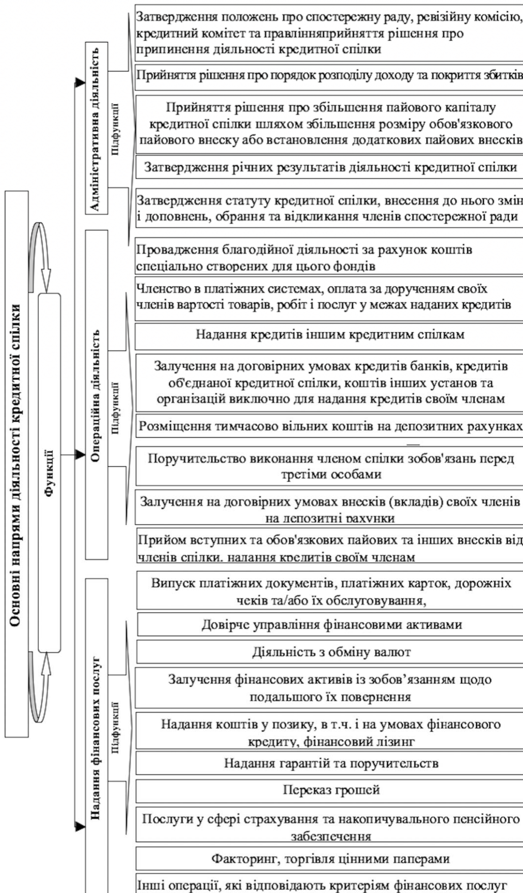
Рис. 1. Функціонально-організаційна структура кредитної спілки