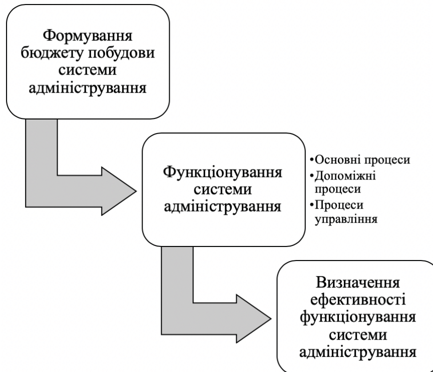
Рис. 2 Модель економічного обґрунтування побудови систем адміністрування

C_{ру} – витрати на реалізацію процесів управління у системах адміністрування.