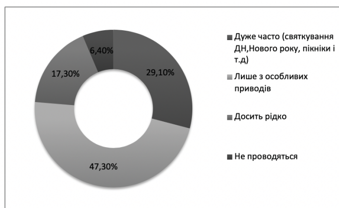
Рис. 3 Результати відповідей на запитання «Як часто у Вас проводяться корпоративні заходи?» (структура відповідей респондентів)

В сучасних світових компаніях корпоративна культура має дуже важливу роль та є стимулом для спільного досягнення стратегічних цілей та виконання поставлених завдань. Рис.3 показує рівень розвитку корпоративної культури в компаніях респондентів.