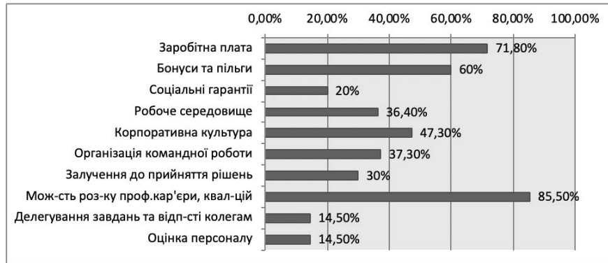
Рис.1 Результати відповідей на запитання «Що на Вашу думку є найефективнішим інструментом мотивації?» (% позитивних відповідей респондентів)

Розмір заробітної плати впливає на ефективність роботи, успішність досягнення організаційних цілей 82,7% опитуваних, що ще раз доводить значимість матеріальних стимулів мотивації.