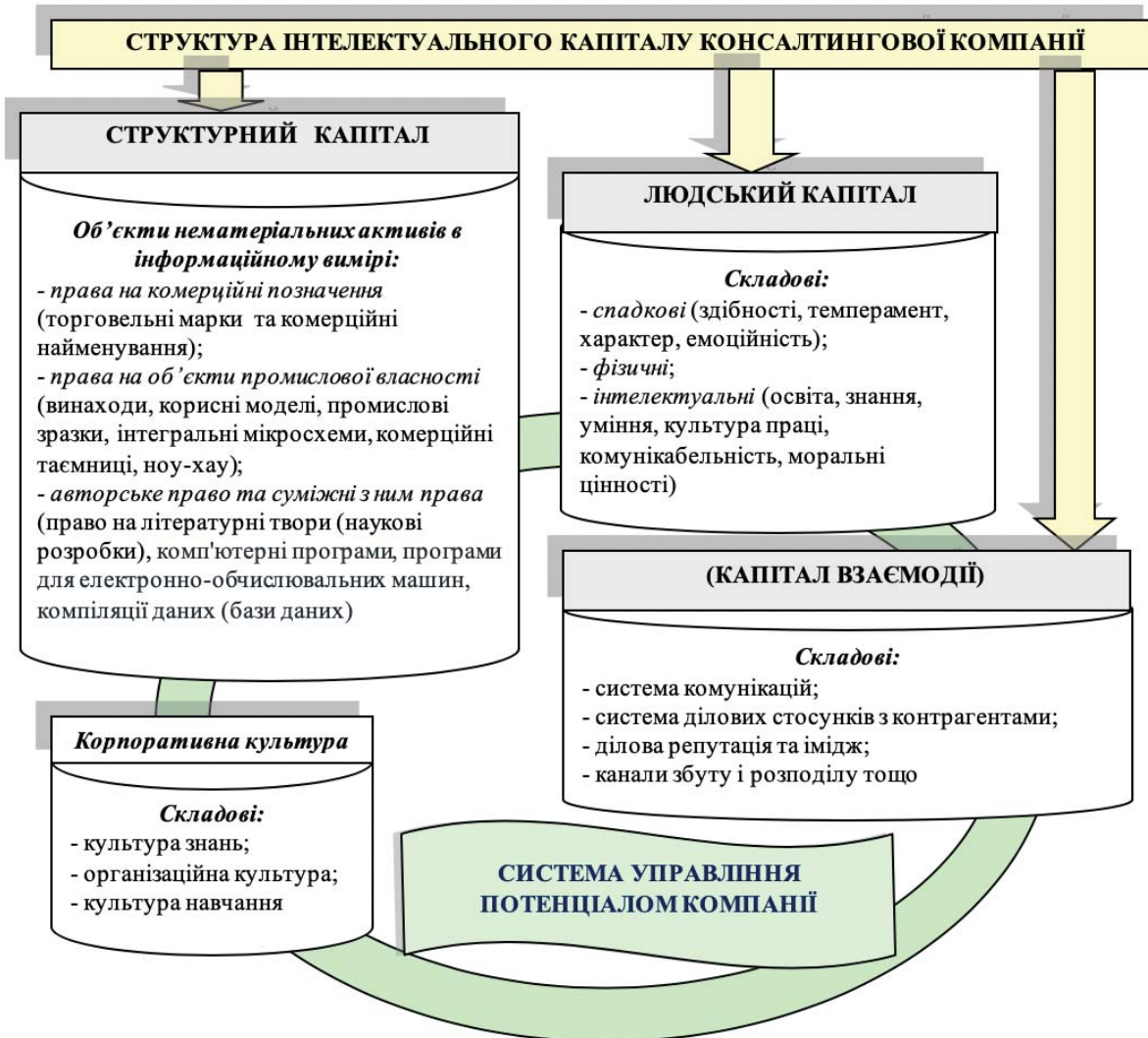
Рис.1 Структура інтелектуального капіталу в системі управління потенціалом консалтингової компанії

Запропонована структура інтелектуального капіталу консалтингової компанії стає ресурсною базою формування та реалізації механізму консалтингової взаємодії [20], яку будемо розглядати як сукупність «стратегічних ресурсів консалтингу», особливо нематеріальних та людських, оборот яких буде забезпечувати досягнення нової якості консалтингових послуг та отримання права компанії на високі соціально-економічні результати з урахуванням стандарту консалтингового обслуговування. В зазначених умовах підвищення результативності взаємодії складових інтелектуального капіталу консалтингової компанії буде проходити під впливом корпоративної культури.