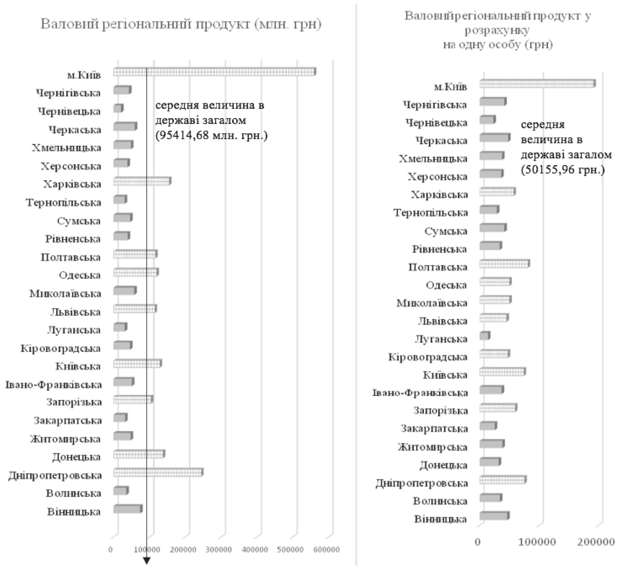
Рис. 1 Параметрична карта депресивності регіонів України у валовій доданій вартості, 2017 р.

Чернігівська, Чернівецька, Хмельницька, Херсонська, Тернопільська, Сумська, Рівненська, Луганська, Івано-Франківська, Закарпатська, Житомирська, Волинська. При цьому, за значеннями індексу фізичного обсягу валового регіонального продукту (у цінах попереднього року), окреслені території доцільно класифікують у розрізі (рис. 2):