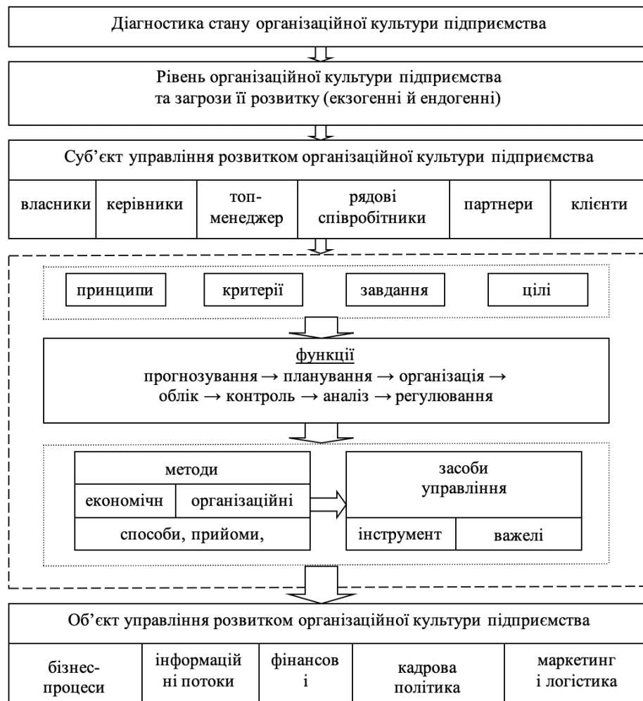
Рис. 3 Структурні складові організаційно-економічного механізму управління розвитком організаційної культури підприємства