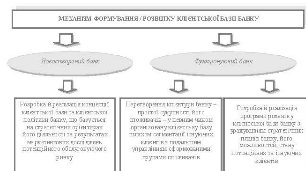
Рис. 1. Механізм формування / розвитку клієнтської бази новоствореного та функціонуючого банку

На відміну від існуючих підходів до формування клієнтської бази банку, пропонується виокремити механізми формування (розвитку) клієнтської бази для новоствореного банку й вже існуючої банківської установи, кожен з яких має свої особливості та порядок реалізації (рис. 1).