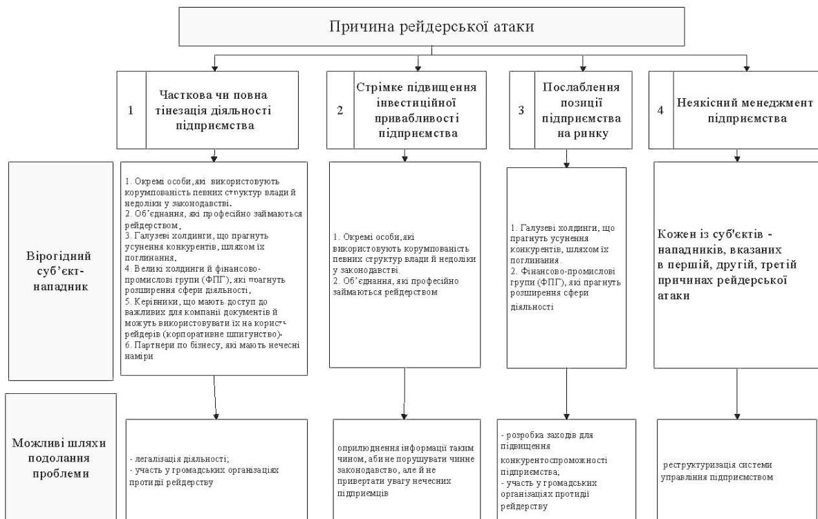
Рис. 2. Заходи, що сприятимуть зменшенню вірогідності рейдерських посягань