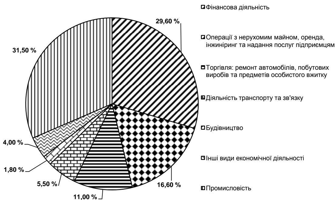
Рис. 2. Інвестиції в галузі економіки станом на 01.01.2013 р. [1]